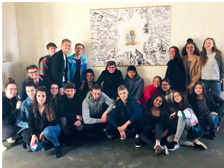
Le résultat final de notre semaine thématique

Seule contre tous, battante malgré tout Je résiste là, la Terre serrée contre moi Entourée de ces horribles choses dont l'humain est la cause Tout le monde reste silencieux et lève vers le ciel les yeux Au lieu d'agir ils laissent la Terre périr Rejoignez-moi, prenez la Terre dans vos bras Il est temps de changer, on est resté sans bouger Tous ensemble on est plus forts, sauvons notre Terre car elle vaut de l'or! Comprenez les enjeux De notre belle planète bleue Décroisez vos bras Et plus forts on deviendra Je périrai, on ne pourra plus m'habiter Ceux que je loge ne me font aucun éloge Comblez-moi d'amour, ne me jouez pas de tours J'ai cru en un avenir radieux mais pas désastreux Je ne pourrai pas réaliser tous vos rêves égarés Vos générations sont la cause de ma destruction Vous avez beau tout gagner mais cette guerre vous la perdrez! Comprenez les enjeux De notre belle planète bleue Décroisez vos bras Et plus forts on deviendra