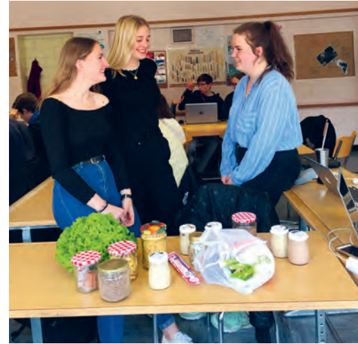
Le groupe « zéro déchet ».